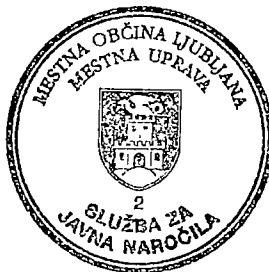
Tadeja Möderndorfer Vodja službe